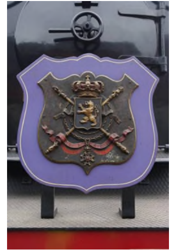
Pavillon royal à l'avant de la 18.051. (Réf. L2178-03)