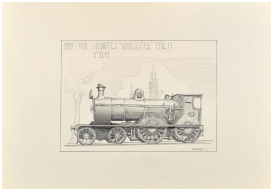
« 1899-1900 : Locomotif "Dunalastair" type 17 n°2412 » (Réf. 10931)