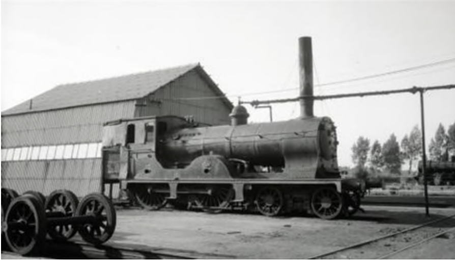
Locomotive à vapeur sans tender A511/323 à Hasselt, utilisée comme générateur fixe de vapeur dans la remise de Hasselt. (Ref. Q0175)

locomotives répondaient mieux aux attentes de l'époque.