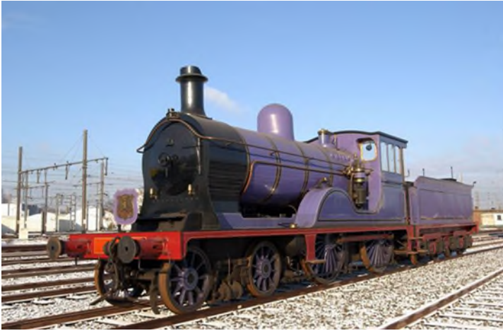
Locomotive à vapeur 18.051 avec tender 18.020 (L2669-82)

L'élégante ligne de cette machine ainsi que sa livrée bleu violacé rendent hommage au « Caledonian Railway » écossais. Dans le cadre de sa restauration pour Train World, la type 18 retrouvera sa livrée d'origine brun chocolat qui était celle des Chemins de fer de l'Etat belge avant 1930.