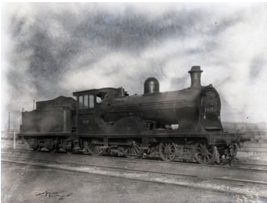
Locomotive à vapeur 18.059 (Réf. Z07542)

Gresham & Craven, développaient 880 ch et pouvaient remorquer 375 t à 95 km/h sur des lignes à profil facile.