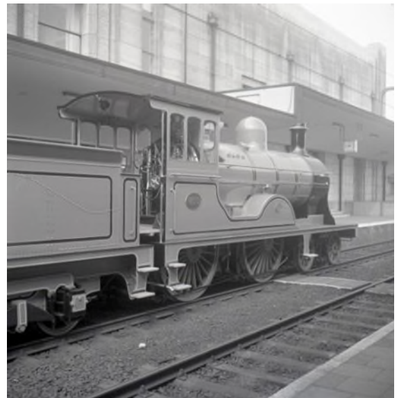
Locomotive à vapeur 18.051 avec le train Royal à Bruxelles-Nord (Réf. Z07432C)

A cette occasion, elle fut repeinte en violet à l'Atelier Central de Salzennes afin de souligner son origine écossaise. Un an plus tard, la locomotive sera exposée en tête des voitures royales à l'occasion du 700ème anniversaire de la ville d'Ostende. Elle est dès lors munie du pavillon royal à l'avant de la locomotive.