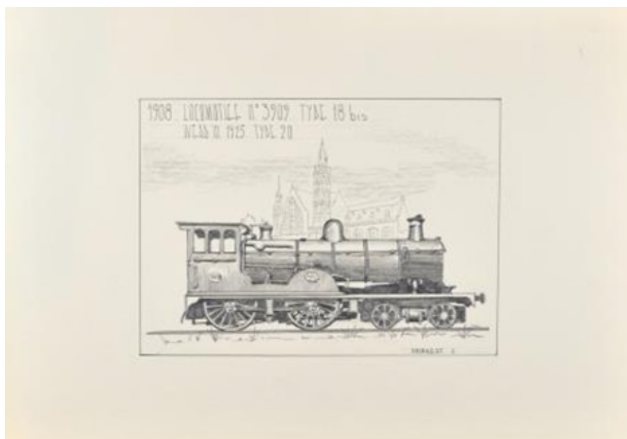
"1908 : Locomotief N° 3909 type 18 bis werd in 1925 type 20", J. Poupaert (Réf. 10870)

En 1908, l'Etat belge désire encore améliorer ses 2B 4 et une troisième version du type 18 est construite par la Franco-Belge (6), Tubize (6) et Gilain (3). Lors de leur mise en service, ces machines comptaient parmi les plus puissantes 2B européennes. Ici, on avait allongé la distance entre les plaques tubulaires et remplacé le bogie Adams à roues de 1,067m par le bogie freiné du système Flamme à plus grand empattement (2,25m contre 1,981 m) et roues plus petites (900 mm). Elles pesaient 58,90 t en ordre de marche et développaient 1100 ch pour une vitesse max de 120 km/h en palier.