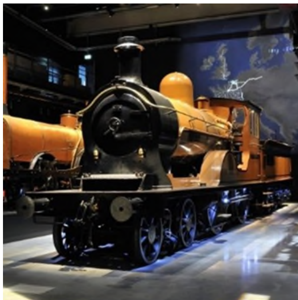
Locomotive à vapeur 18.051 avec tender 18.020 à Train World (Réf. 2576)