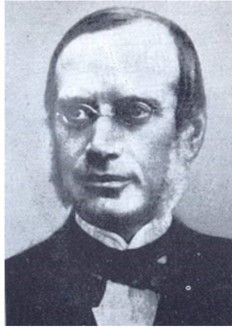
Egide Walschaerts

En quelques mots : Chef d'atelier, il est l'inventeur du système, révolutionnaire à l'époque, de la distribution à coulisses permettant le renversement de la marche d'une locomotive et la variation de la détente en vapeur en marche.